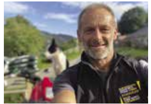
Alun Elidyr Llysgennad Partneriaeth Diogelwch Fferm Cymru

Os byddwch chi'n ymrwymo HEDDIW i roi'r dulliau gweithredu a diogelu sydd wedi'u hargymell yn y llyfryn hwn ar waith (dulliau sy'n amlgu rhai o'r pethau mwyaf cyffredin a rhwystradwy a allai achosi damweiniau ar eich fferm), byddwch chi'n helpu lleihau'r risg o farwolaeth neu anafiadau difrifol ar eich cyfer chi, aelodau o'ch teulu a'ch gweithwyr.